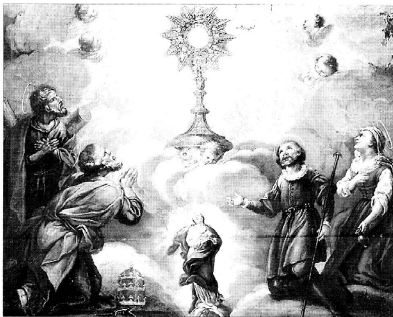
«Santos adorando el Santísimo Sacramento», óleo atribuido a Goya